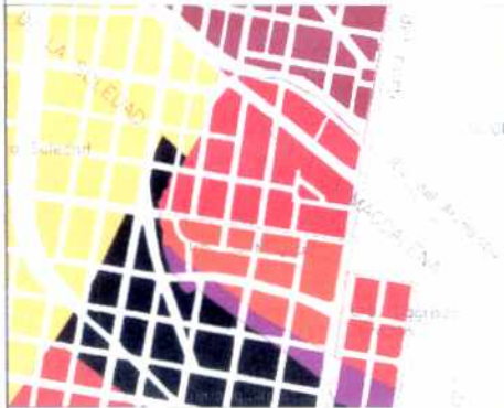
PLANO DE URBANIZACIONES

La circunstancia de no quedar sobre vías arterias oriente-occidente, pudo haber sido la causa de su excepcional conservación. Las áreas verdes de antejardines y calles ofrecen, junto con la escala de sus viviendas de dos pisos un panorama urbano singular.