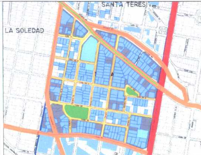
Inmuebles de Interés Cultural - MORFOLOGÍA EN PLANTA